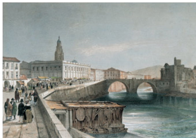
Río Segura a su paso por Murcia en el siglo XIX.

A partir del siglo XVIII , surgieron trazados geométricos a causa del crecimiento de algunos núcleos (Jumilla, Yecla, Cartagena y Cieza) o a la creación de una nueva ciudad, como Águilas.